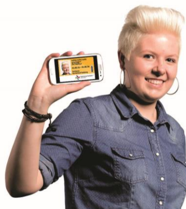
Bildnachweis: akzente Salzburg / Abdruck honorarfrei!

von akzente Salzburg. Einfach den persönlichen QR-Code, den alle Jugendlichen gemeinsam mit ihrer Plastikkarte per Post bekommen haben, direkt in der S-Pass App scannen (Menü: s'COOL-CARD), dann ist die digitale Karte in das Smartphone geladen. Notwendig ist dafür lediglich eine Internetverbindung.