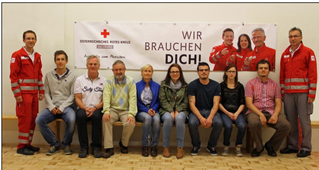
Bildnachweis: Österreichisches Rotes Kreuz (ÖRK)/Abdruck für Presse-zwecke honorarfrei.

Das Rote Kreuz wünscht den neuen Kolleginnen einen guten Start.