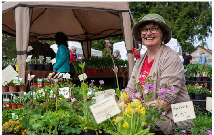
BLÜTENFEST im Biodorf Seeham