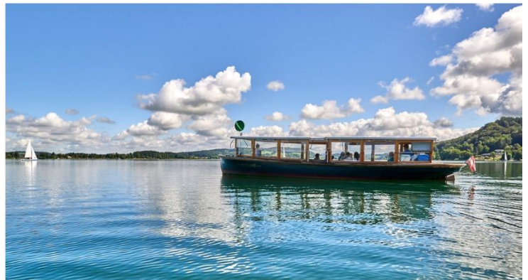
AHOI SEENLAND ab 1. Mai!