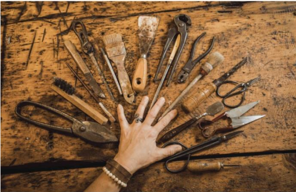
OIS HONDGMOCHT HANDWERKSTATT im BioArt Campus