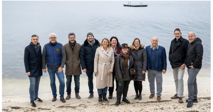
AUSSCHUSS des Tourismusverbands