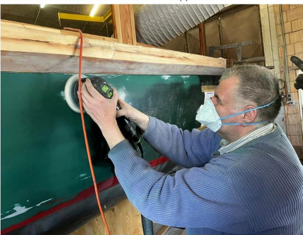
GENERALSANIERUNG der „Seenland“